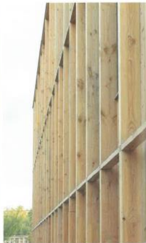
↑ Detail fasády.