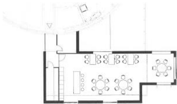
↑ Pôdorys 3. NP