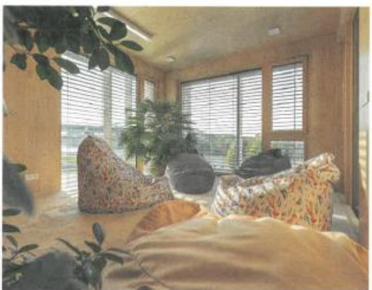
↑ Na 3. NP sa nachádza presvetlená oddychová miestnosť.