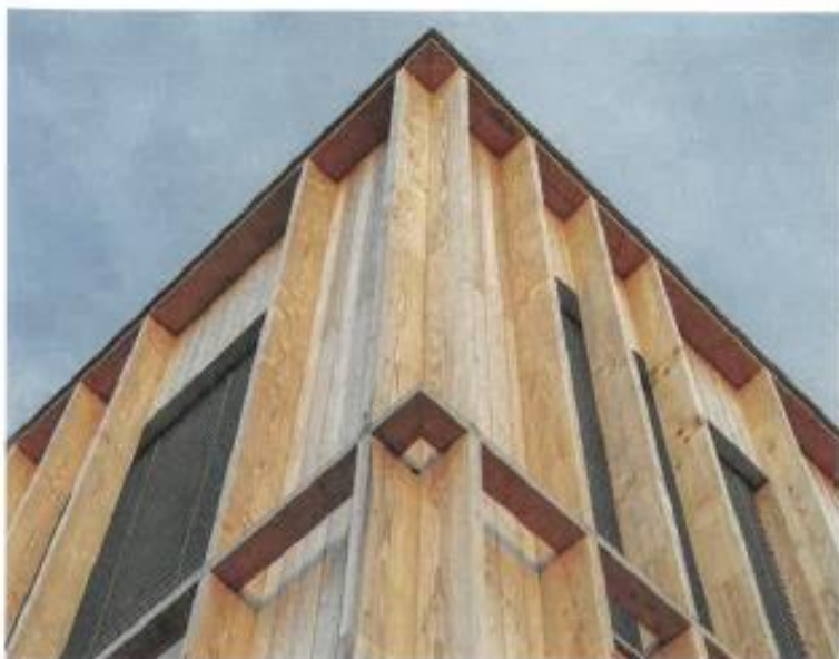
↑ Rebrowanie je riešené pomocou začapovania a prišraubovania.

štrukčného hľadiska je prístavba postavená najmä na ekologických CLT paneloch. Aplikovali ich v stenových a stropných konštrukciách a v pohľadovej kvalite ich nájdeme aj v interieri. Medzi jednotlivými miestnosťami je predsadená rámová konštrukcia deliacich priečok, vyplnená akustickou izoláciou. Architekti siahli po drevo-hliníkových oknách zasklenených izoláčnym bezpečnostným trojsklom. Povrch fasády tvorí obklad zo sibírskeho smrekovca, ktorý je využitý rovnako i na rebrovanie fasády. Doplnujúce materiály fasády objekt vizuálne rozčleňujú na jednotlivé stavebné celky. „Parapety idú v tomto prípade až pod úroveň konštrukcie podlahy. Okná, parapet a nadpražia sa stretávajú v úrovni horizontálnej lamely. Bolo