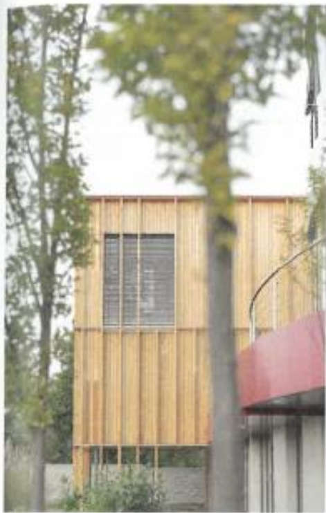
↑ Drevo prechádza celou budovou.